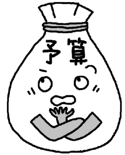
一人当たりの借入額と貯蓄額